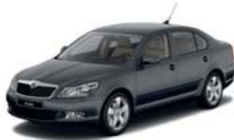
Anthracite Grey metallik