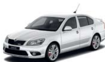
Brilliant Silver metallik