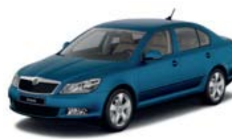
Lava Blue metallik