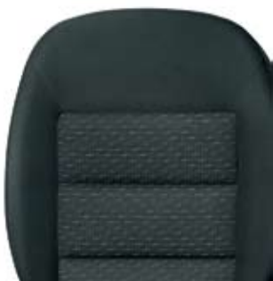
Active - varustusastme istmed.

Elegance-varustusaste on saadaval luksusliku Shadow' salongisisuga (must või beez), kus armatuurlaud on kas ainult must või musta ja beezi kombinatsioonis. Ilulülistud, raadio, navigatsiooniseadme ja konditsioneerid servad, tuhatoosi kate ja käigukangi ümbris on Elegance-disainiga. Elegance - varustusaste on ainuke, kuhu kuuluvad puidustriga dekoratiivelemendid.