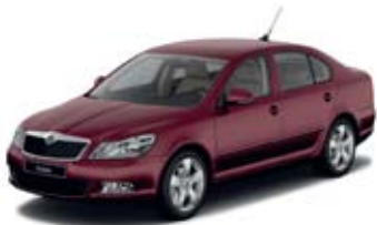
Rosso Brunello metallik