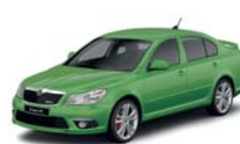
Rally Green metallik