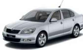
Brilliant Silver metallik