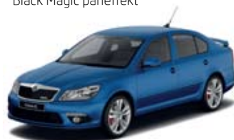
Race Blue metallik