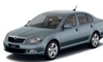
Platin Grey metallik