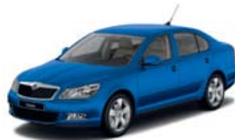
Storm Blue metallik