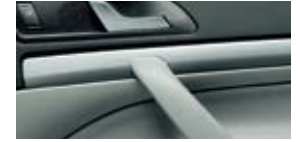
Ambition'i ja 4x4 iluist