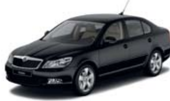
Black Magic pärleffekt