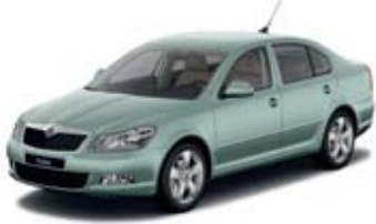
Arctic Green metallik