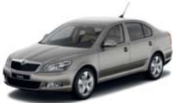
Cappuccino Beige metallik