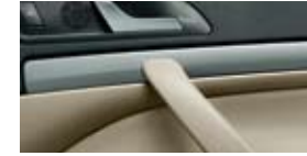
Декоративные планки Elegance