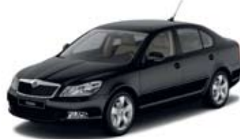
Black Magic перламутровый