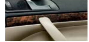
Декоративные планки Elegance