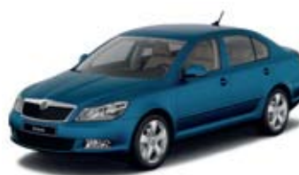
Lava Blue металл