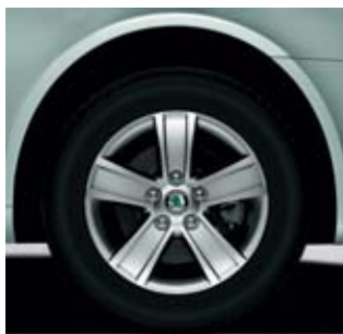
Ambition имеет диски 6.0J x 15" Puxis в стандартном варианте оснащения Ambition.