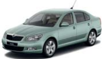
Arctic Green металл