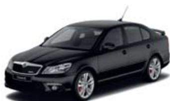
Black Magic перламутровый