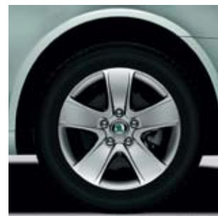
Легкосплавные диски Elegance 6.0J x 16" Crateris входят в стандартное оснащение пакета.