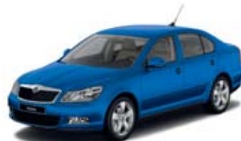
Storm Blue металл