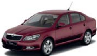
Rosso Brunello металл