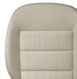
Сиденья в стиле Elegance.