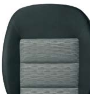
Сиденья в стиле Ambition.