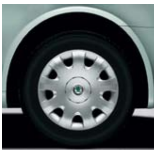
6.0J x 15" металлические диски Авангардной решеткой снабжен вариант Active – в стандартном варианте всех степеней оснащения.