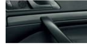
Декоративные планки Active