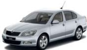
Brilliant Silver металл