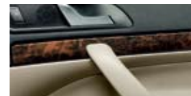
Декоративные планки Elegance Elegance