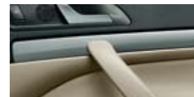
Декоративные планки Elegance