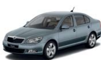
Platin Grey металл