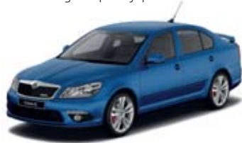
Race Blue metallik