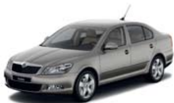
Сappuccino Beige металл