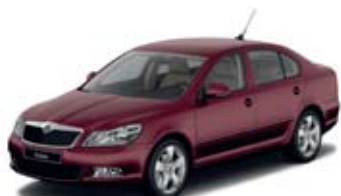
Rosso Brunello металл