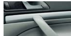
Декоративные планки Ambiente и 4x4