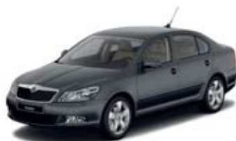
Anthracite Grey металл