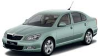
Arctic Blue металл