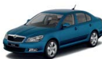
Lava Blue металл