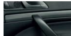
Декоративные планки Comfort