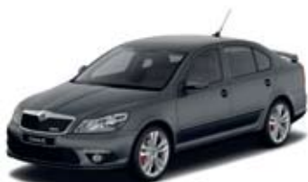
Anthracite Grey перламутровый

Octavia RS – один из мощнейших и быстрых автомобилей среди моделей серийного производства Škoda. При этом он Ваш удобный и безопасный спутник. Его внешность имеет спортивный стиль до последней детали и заряжает адреналином - легкосплавные 18-дюймовые колесные диски Neptune, передний и задний спойлер, хромированные глушители, фары дневного света LED . К ним можно дополнительно заказать темные тонированные стекла, ксеноновые фары и противотуманные фары с поворотной функцией. Спортивную атмосферу в салоне поддерживают удобные кожаные сиденья с логотипом RS, трехспицевое кожаное рулевое колесо, металлические накладки на педали, CD/MP3-магнитола Swing вместе с двухзонной системой кондиционирования воздуха Climatronic .