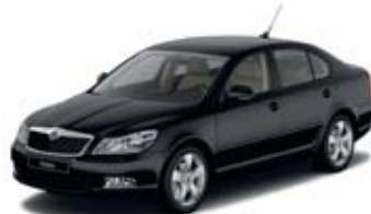
Black Magic перламутровый