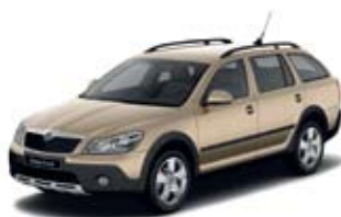
Safari Beige металл (специальный цвет Octavia Scout) На выбор предлагаются все остальные цвета Skoda Octavia.