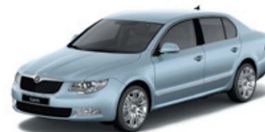
Aqua Blue металл