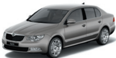
Carrusino Beige металл