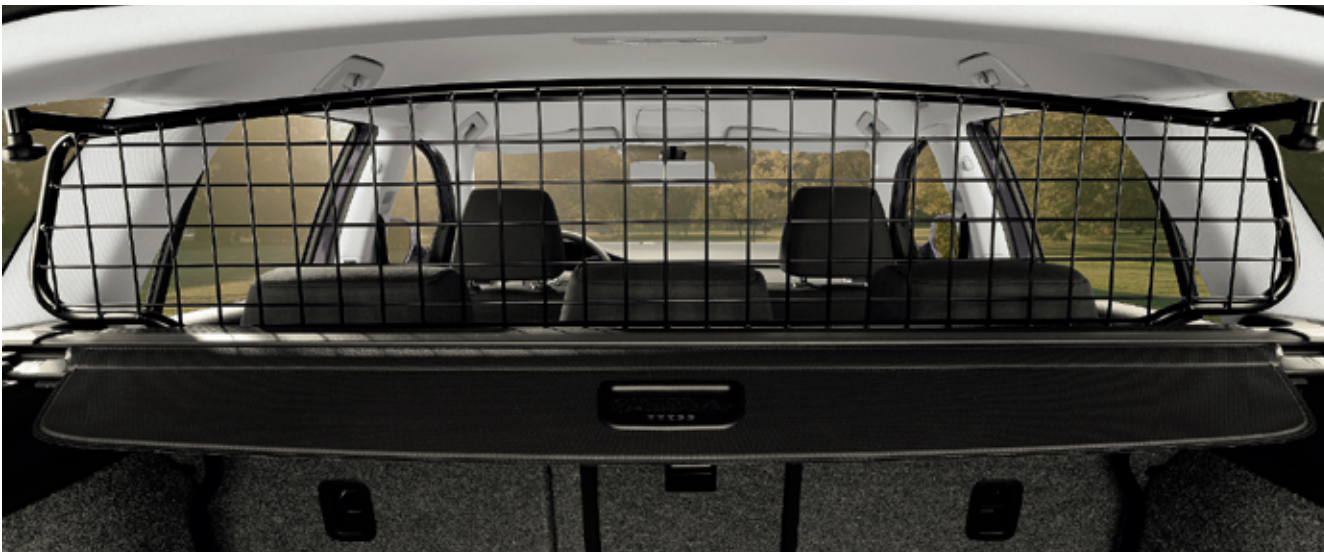
Сетка для собаки - 165 €