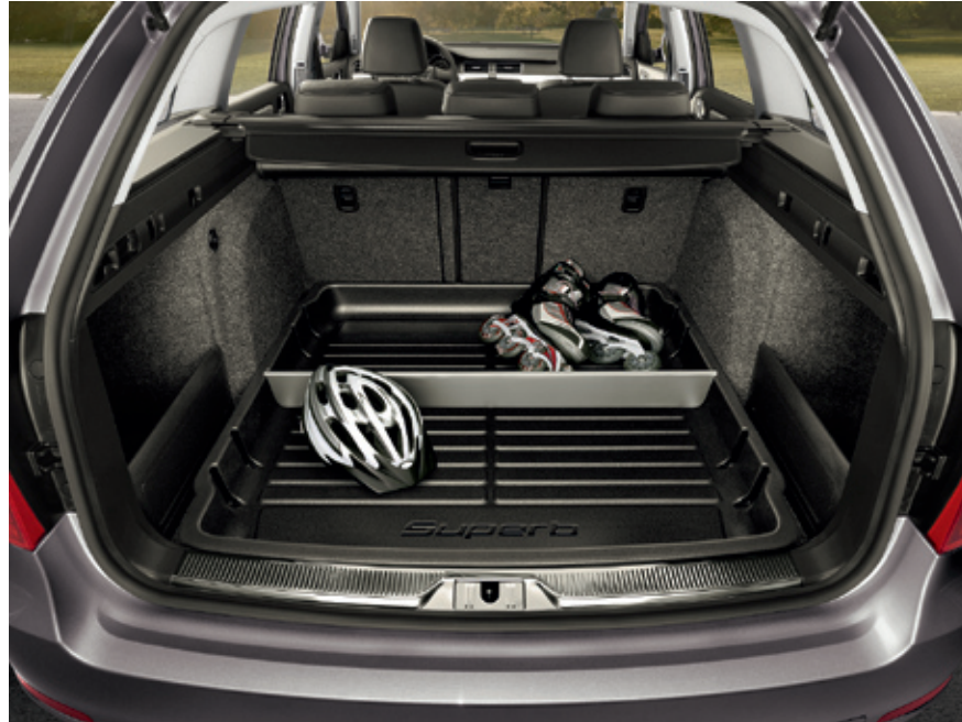
Коврик для багажника, пластиковый* - 180 €