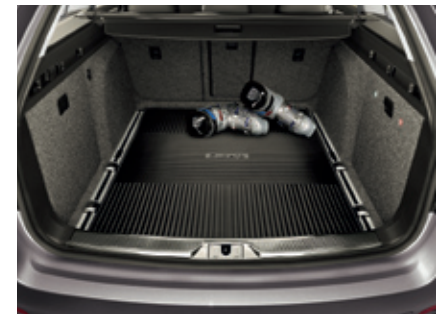
Коврик для багажника, резиновый - 42 €