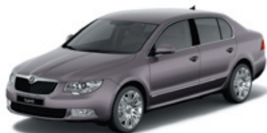
Amethyst Purple металл