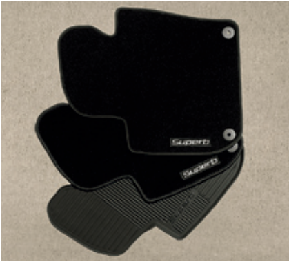
Резиновые коврики - 40 €