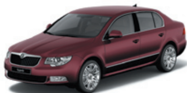
Rosso Brunello металл