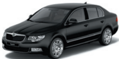
Black Magic перламутровый