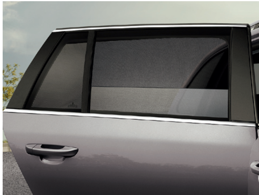
Занавески на заднее окно - 122 €