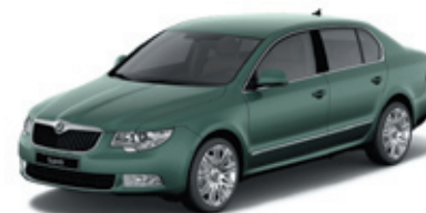
Malachite Green металл