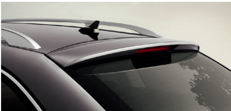
Спойлер на задний люк - 244 / 296 €