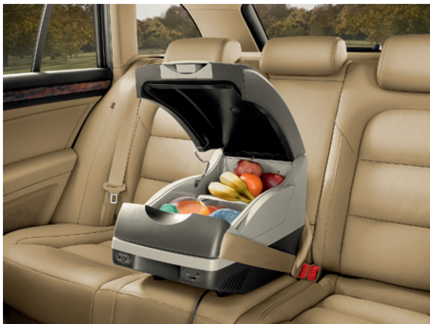
Автохолодильник 15 л. - 148 €