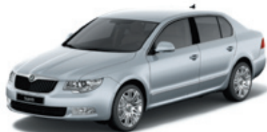
Brilliant Silver металл