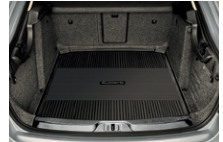
Коврик для багажника, пластиковый* - 63 €