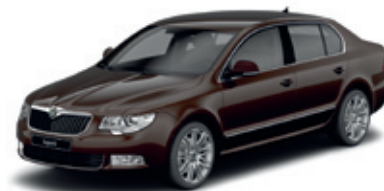
Magnetic Brown металл