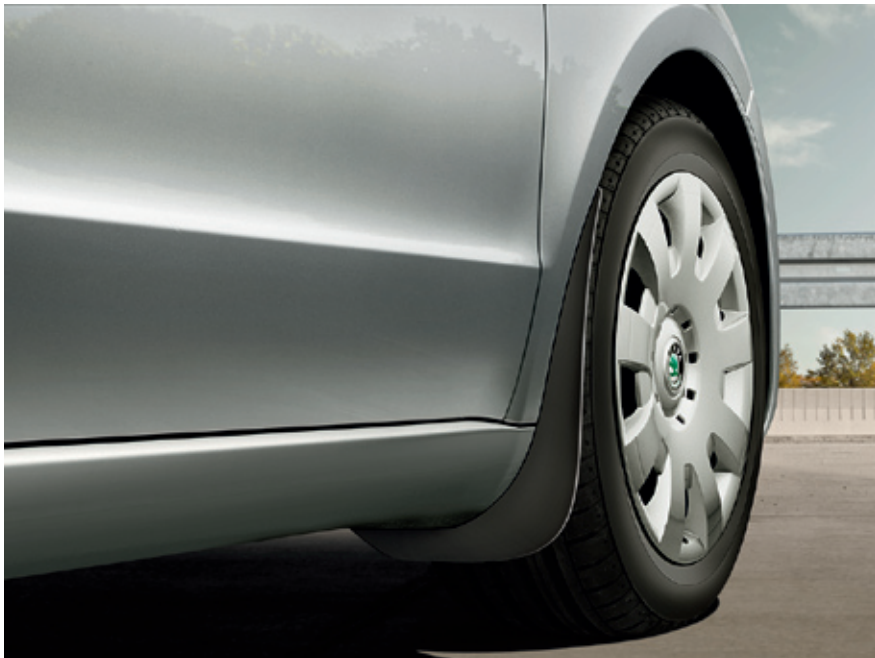
Брызговики спереди+сзади - 80 €