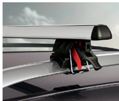
Рама на крышу, ал. - 225 / 154 €