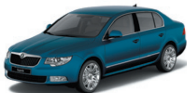
Lava Blue металл