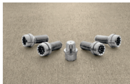
Комплект болтов безопасности - 40 €