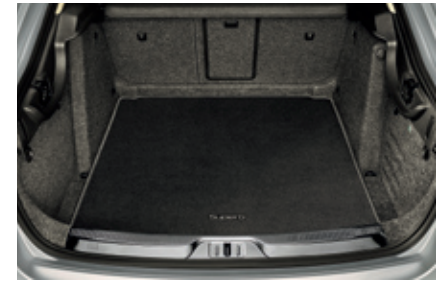
Коврик для багажника, текстильный - 28 / 30 €