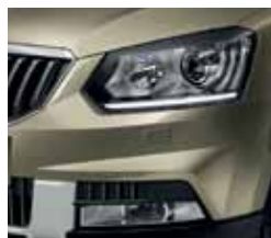
Bi-xenon с передними LED-фарами