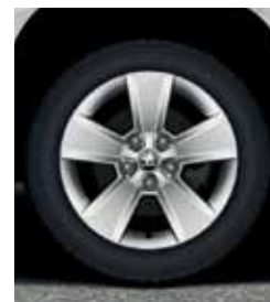
City: Литые диски 16" NEW DOLOMITE