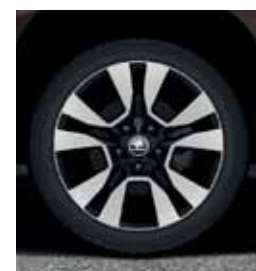
Outdoor: Литые диски 17" ORIGAMI