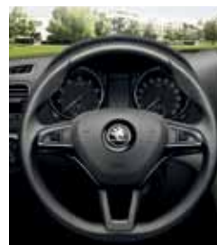
Кожаный MF-руль с 3 спицами