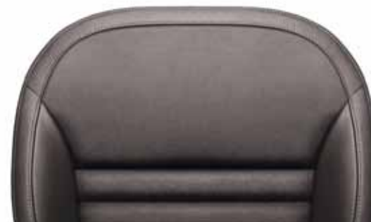
Темно-коричневая кожаная отделка L&K