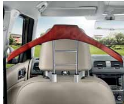
Вешалка на подголовник – 30 €