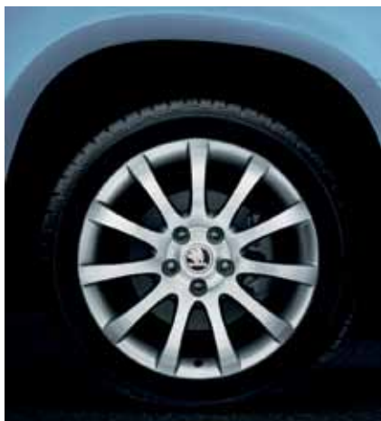
Литые диски «Аппарна» 17" ET45 – 729 €