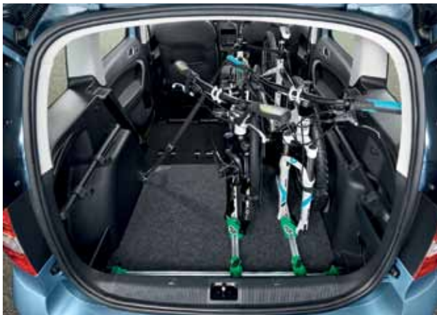
Держатель для велосипедов (2 колеса) в багажник – 307 €