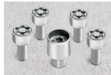
Комплект защитных болтов – 36 €