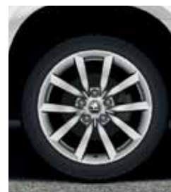
City: Литые диски 17" SCUDO