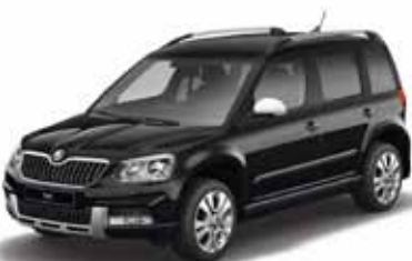
Black Magic эффект перламутра