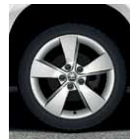
Outdoor: Литые диски 17" EREBUS