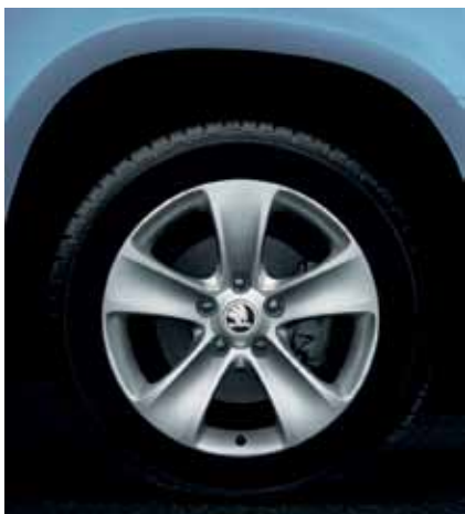
Литые диски «Moon» 16" ET45 – 539 €