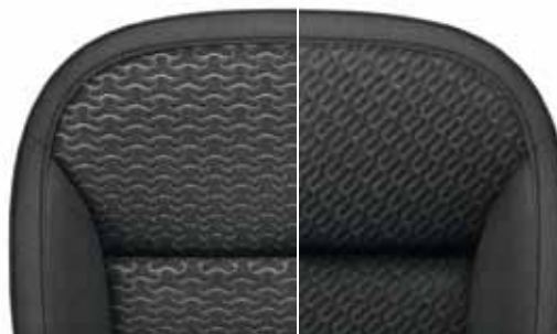
Текстильная отделка «Dune», чёрный текстиль