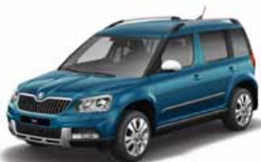
Lava Blue металл