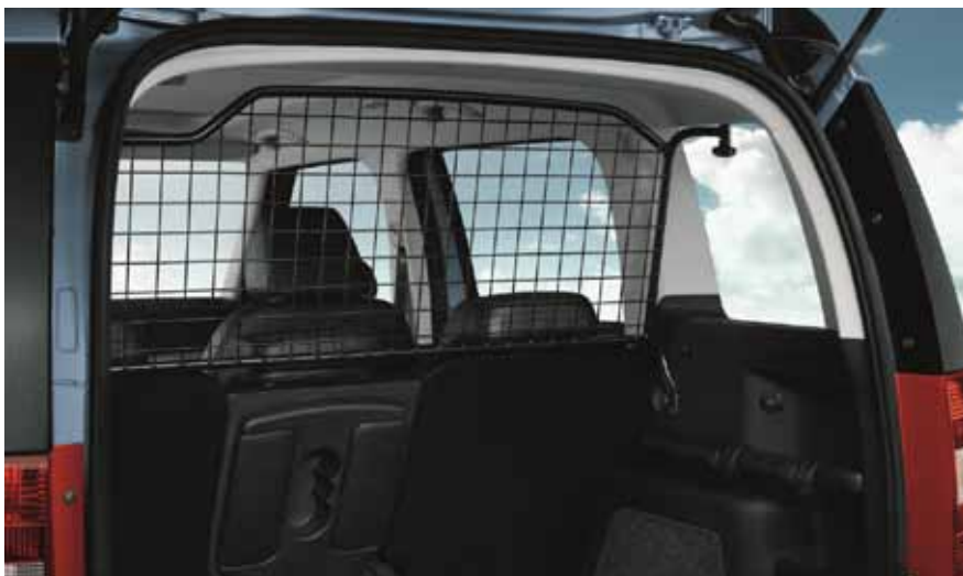
Сетка для собаки - 197 €