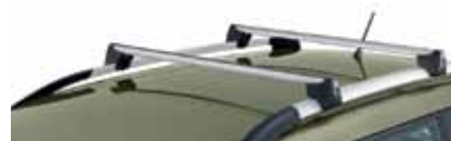
Поперечные рейлинги на крышу – 138 €