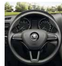
Кожаный руль с 3 спицами