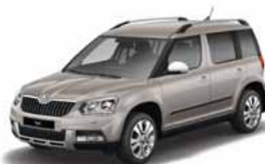
Cappuccino Beige металл