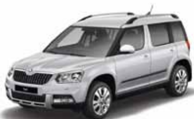
Brilliant Silver металл