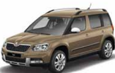
Mato Brown металл