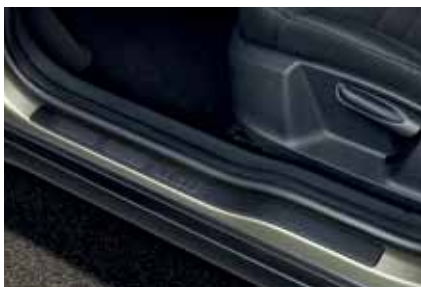
Накладки на порог, черные – 71 €