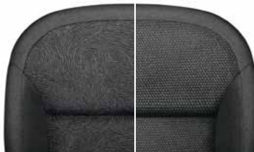
Текстильная отделка «Spirit», чёрный текстиль