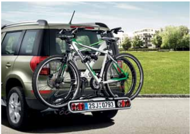
Держатель для велосипедов (2 колес) на прицепное устройство – 398 €