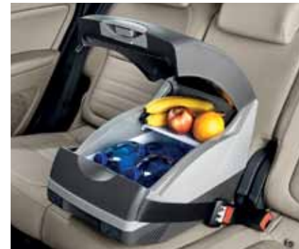
Автохолодильник 15 л – 169 €