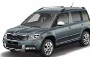
Metal Grey металл