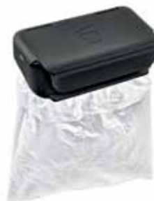
Держатель для мусорного мешка в дверной карман, черный – 20 €