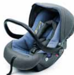
Детское сиденье Baby One Plus (0-13 кг) - 167 €