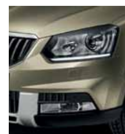
Bi-xenon с передними LED-фарами