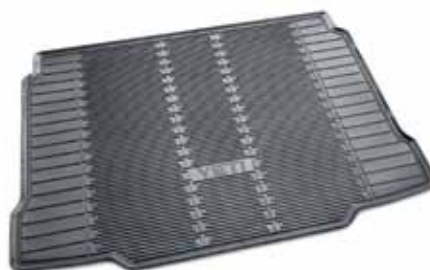
Резиновый коврик для багажника - 43 €