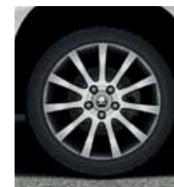
City: Литые диски 17" ANNAPURNA