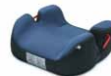
Детское кресло Wavo Kind (15-36 кг) - 49 €