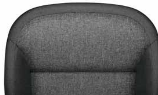
Текстильная отделка «Granite», черный/серый текстиль