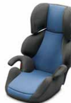
Детское кресло Wavo 1-2-3 (15-36 кг) - 138 €