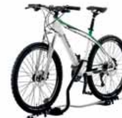
Держатель для велосипедов на крышу AL, блокируемый – 143 €