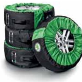
Чехлы для хранения колес – 37 €