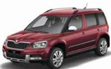
Rosso Brunello металл