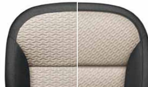
Текстильная отделка «Dune», чёрный/бежевый текстиль (Gobi Sand)