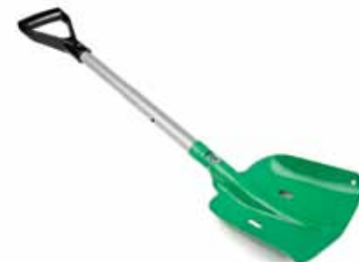
Лопата для снега – 49 €