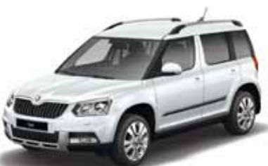
Moon White металл