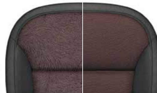
Текстильная отделка «Spirit», коричнево-красный текстиль (Terracotta)