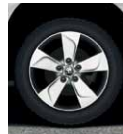
Outdoor: Литые диски 16" NEVIS