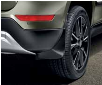
Передняя и задняя ширмы от грязи – 68 €