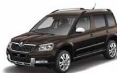
Magnetic Brown металл *