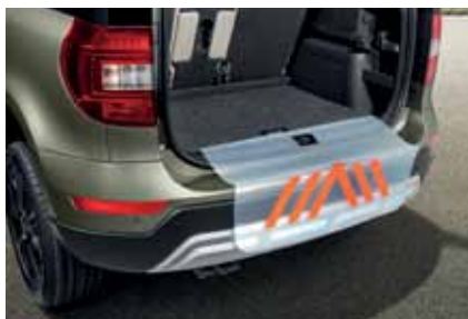
Накладка на задний бампер с треугольником безопасности – 19 €