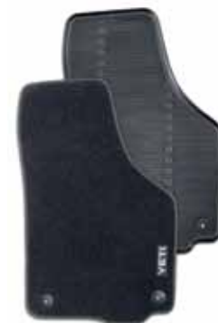
Текстильные коврики 4 шт. - 55 € Резиновые коврики 4 шт. - 50 €