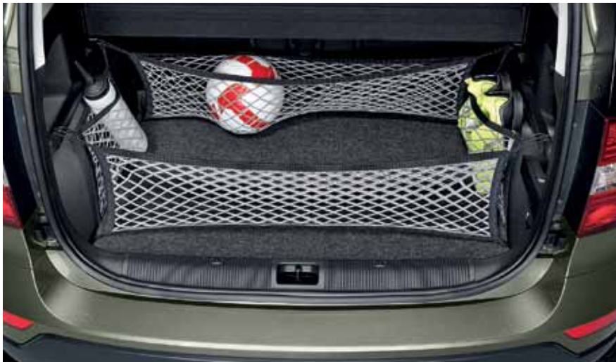
Комплект сеток для багажника (5 шт.) - 59 €