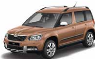
Terracota Orange металл