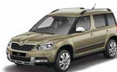
Jungle Green металл