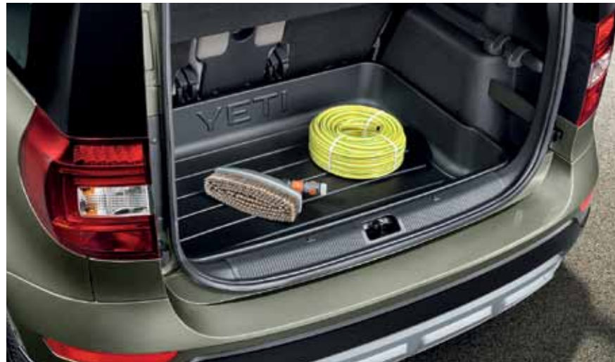
Пластиковый коврик для багажника (с завышенными краями) - 158 €